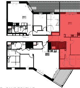
PLAN DE REPERAGE - SANS ECHELLE