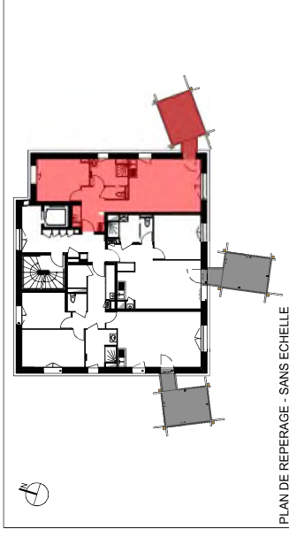
PLAN DE REPERAGE - SANS ECHELLE