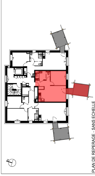
PLAN DE REPERAGE - SANS ECHELLE