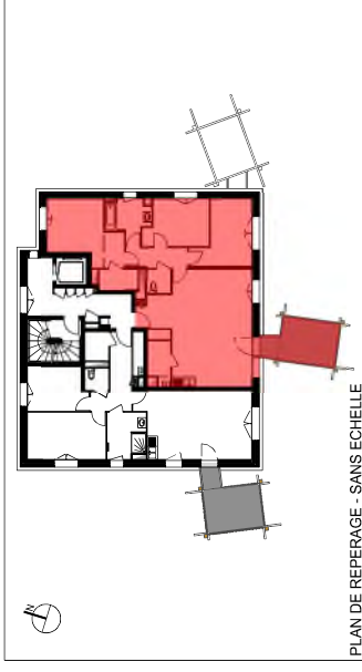
PLAN DE REPERAGE - SANS ECHELLE