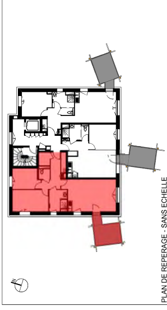
PLAN DE REPERAGE - SANS ECHELLE