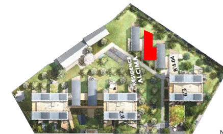
Plan de repérage - sans échelle