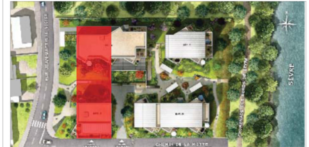
PLAN DE REPERAGE - SANS ECHELLE